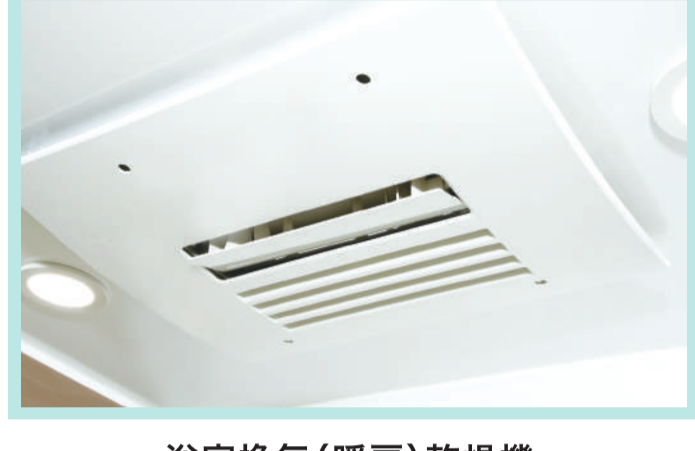
浴室換気(暖房)乾燥機