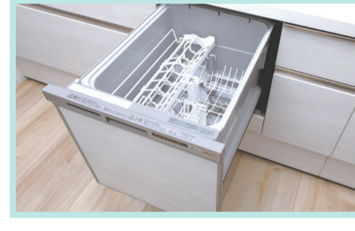
ビルトイン食器洗い乾燥機