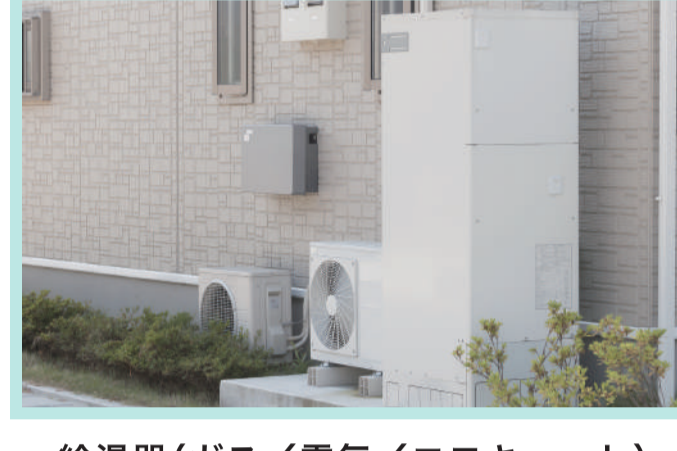
給湯器(ガス/電気/エコキュート)